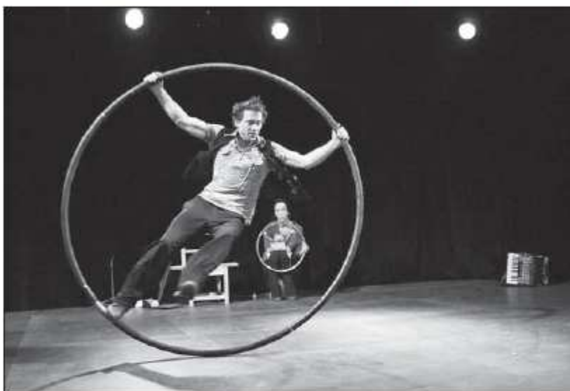
La compagnie haut-viennoise le Cirque Sans Noms est en Argentine au moins jusqu'au 27 novembre.