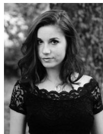
Eleonora Deveze soprano