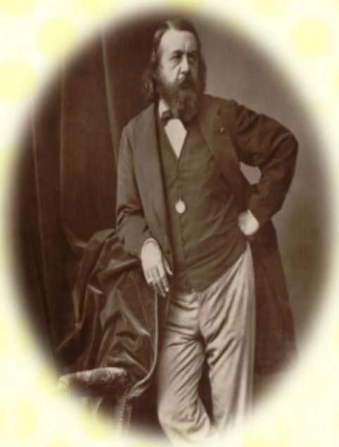
« Premier sourire de printemps » Théophile Gautier