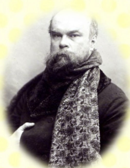
« Le jardin » Paul Verlaine