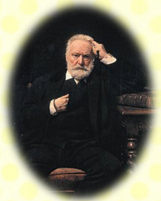
« Nuits de Juin » Victor Hugo