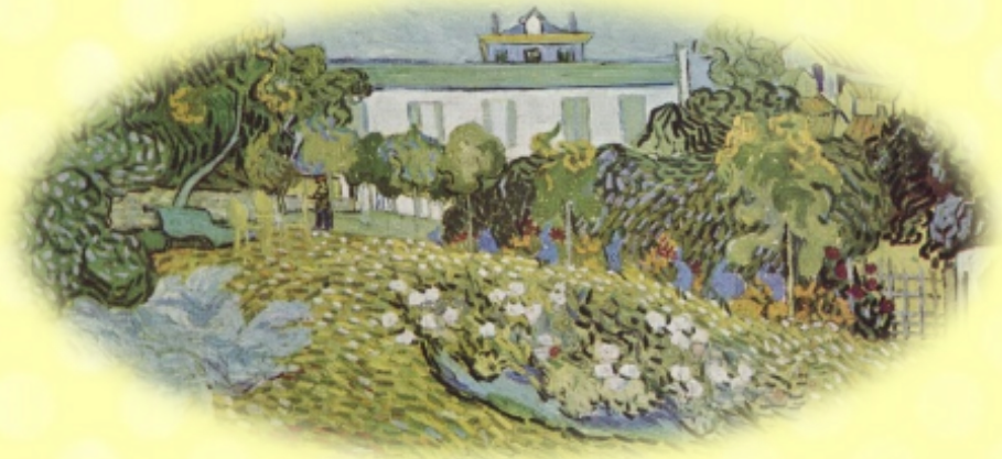
Vincent Van Gogh, Les jardins d'Arles