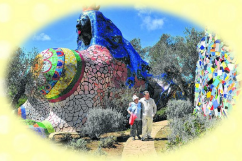
Le jardin des tarots de Niki de Saint-Phalle