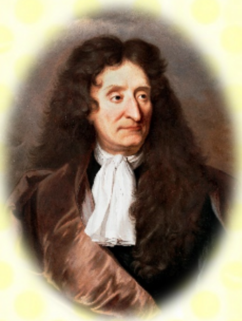
« Le Jardinier et son seigneur » Jean de la Fontaine

Dans la littérature, des écrivains et poètes ont intégré les jardins dans leurs œuvres, les utilisant comme des lieux symboliques où les personnages peuvent se retrouver et réfléchir sur leur propre existence.