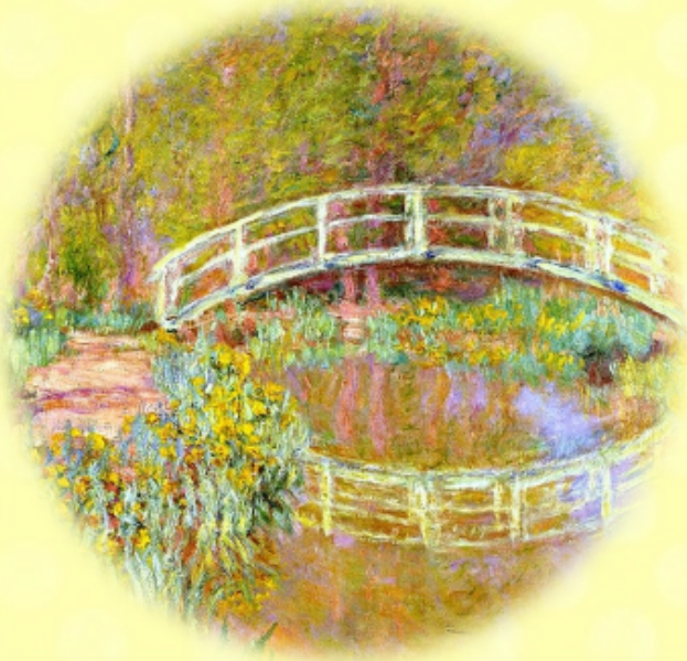
Les peintures de Claude Monet représentant son jardin à Giverny

En peinture, des artistes comme Claude Monet, Vincent van Gogh et Georgia O'Keeffe ont capturé la beauté et la diversité des jardins dans leurs œuvres, utilisant des couleurs vibrantes et des formes organiques pour transmettre leur fascination pour la nature.