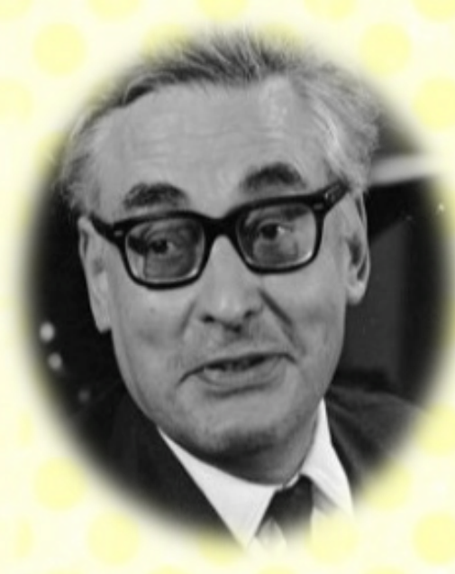
« Battre la campagne » Raymond Queneau