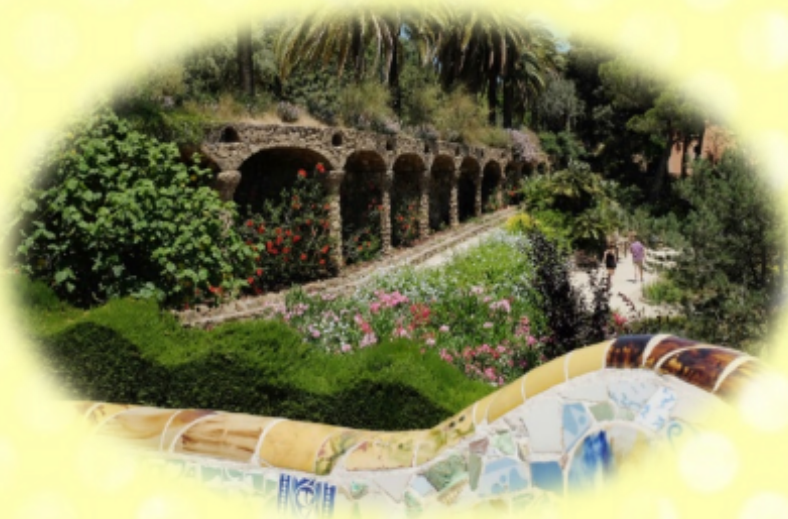
Le parc Guell de Gaudi